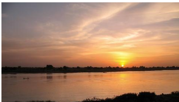
摄影／文字： Elaine Bombay