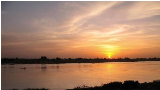
摄影／文字： Elaine Bombay